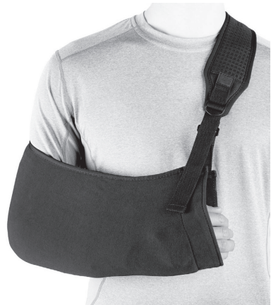
Slika 8. Mitela

Normalno je da osećate bol i nelagodnost nakon operacije, ukoliko osećate obavestite medicinsku sestru. Kada osećate bol, sestra će Vam postaviti pitanje koliko Vas boli, tj da ocenite Vaš bol na skali od 0-10 (0 = bez bola, 10 = najveći mogući bol). Vaš bol možda neće biti uklonjen u potpunosti. Međutim, lekovi protiv bolova mogu učiniti da se osećate prijatnije.