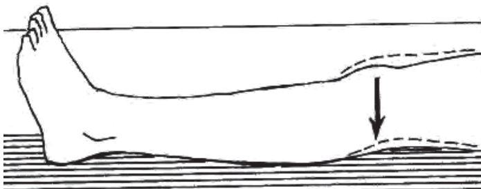
Slika 5. Vežba za nogu

Vaša ruka može biti postavljena u stabilizator (Slika 6), splint ortozu (Slika 7) ili mitelu (Slika 8). U zavisnosti od vrste imobilizacije, biće Vam rečeno da li teba da je nosite i noću. Obavestite sestru ukoliko se javi neka iritacija ispod ili oko imobilizacije. Kada sedite ili ležite, važno je da postavite mali jastuk ili presavijeno čebe ispod lakt, da bi sprečili ruku da ode pozadi i rastegne regiju koja je operisana.