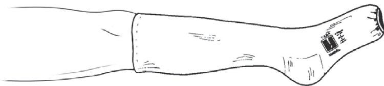
Slika 3. Kompresivna čarapa

Ona pomažu da se krv vrati u srce i tako smanjuju opasnost od stvaranja tromba nakon operacije, kada ste manje aktivni. Kompresivne čarape su jedana vrsta tih pomoćnih sredstava (Slika 3). Čarape ćete nositi na obe noge do operacije, tokom boravka u bolnici, sve do kontrole. U bolnici će Vam osoblje pomoći da dva puta dnevno skidate čarape na po 30 minuta. Članovima porodice će biti objašnjeno kako da Vam pomognu kod postavljanja i skidanja čarapa. Čarape možete prati i ručno.