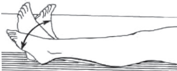
Slika 4. Vežba za stopalo (zglobna pumpa)