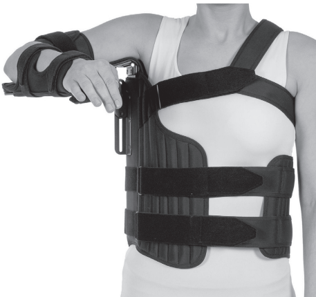
Slika 7. Splint ortoza ramena