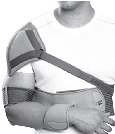
Slika 6. Stabilizator ramena